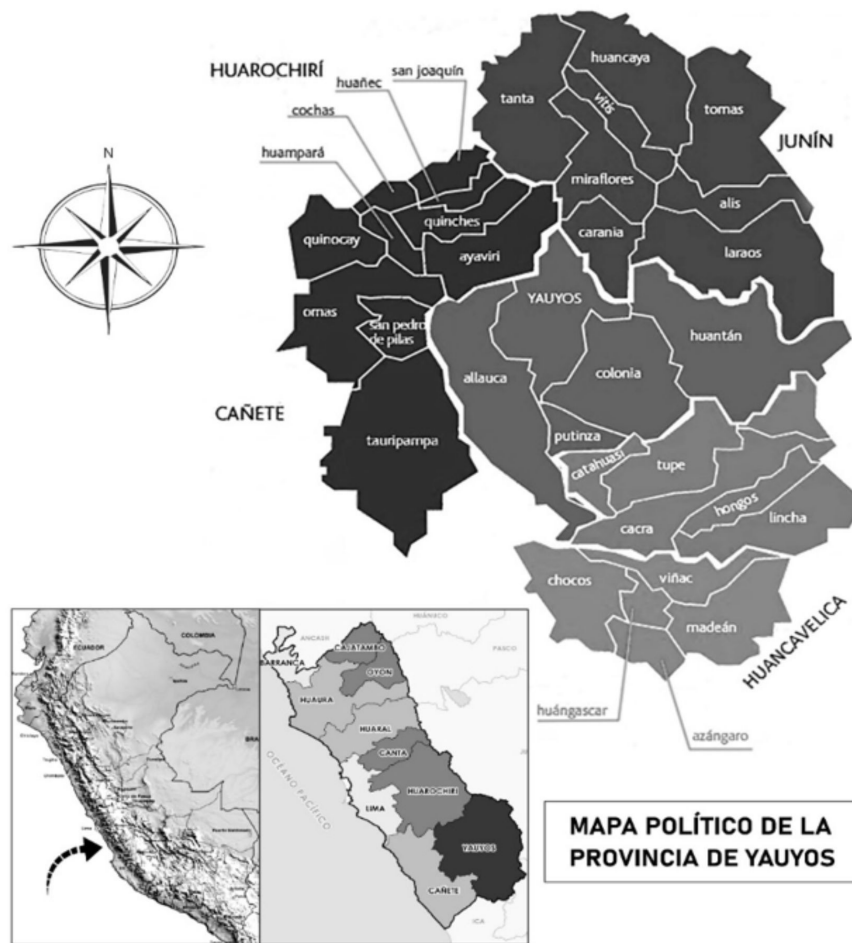
Imagen 2. Mapa político de la provincia de Yauyos-región Lima provincias.