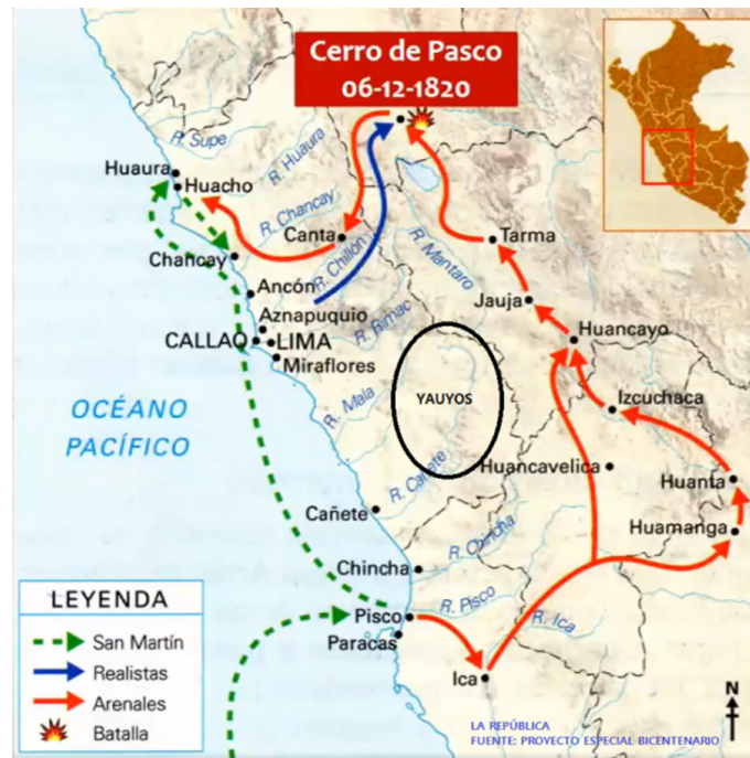
Imagen 1. Ruta de expedición de Juan Antonio Álvarez de Arenales 1820.