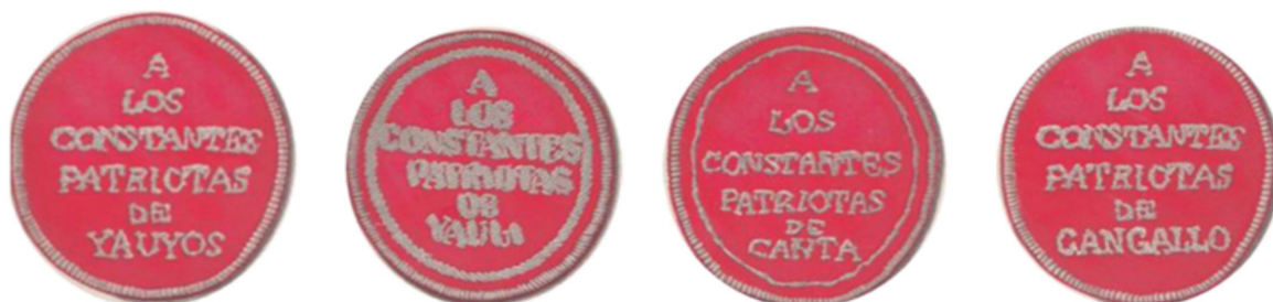
Imagen 4. Escudos elípticos asignados por San Martín a los patriotas de Yauyos, Yauli, Canta y Cangallo.

El 24 de noviembre de 1821, se dicta un nuevo decreto, mediante el cual se dispone que los peruanos de la provincia de Yauyos, al igual que de Cangallo, Huarochirí, Canta, Yauli y Tarma, de la edad de 15 a 50 años, llevarán en el brazo izquierdo un escudo elíptico de paño encarnado, bordado con hilos de plata, con la siguiente inscripción: «a los constantes patriotas de Yauyos», con la variación del nombre de acuerdo a la provincia, según lo indicado. De esta forma, se establece que cada gobernador provincial envié la lista de los participantes y se responsabiliza al comisario del ejercito de custodiar su confección a costa de los fondos públicos y remitirlos a cada provincia. 14